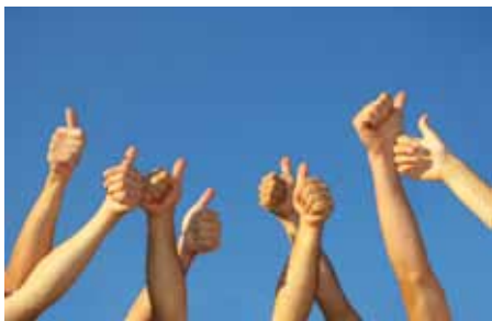
TEKST: MALIN F. PEDERSEN