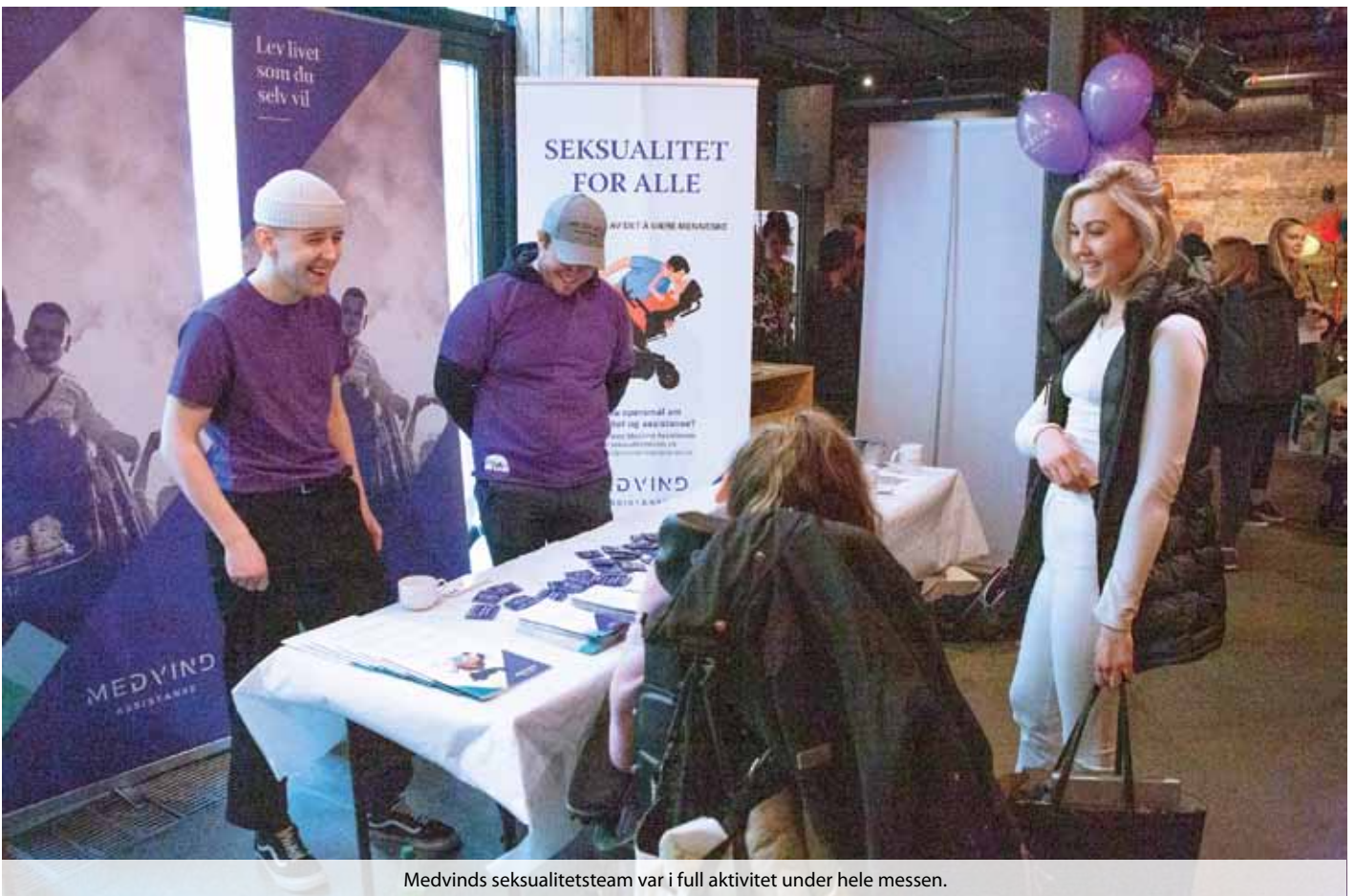
Medvinds seksualitetsteam var i full aktivitet under hele messen.