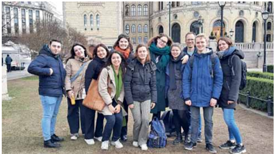
Nijmegen-studenter foran Stortinget i Oslo.

H onours-programmene er en ny måte å studere på, og tilbys blant annet ved Universitetet i Oslo. Man bringer sammen studenter som deltar i ulike studieprogram for at disse skal lære av hverandre, samt ha felles undervisning, blant annet knyttet til teknologi, kunstig intelligens og filosofi.