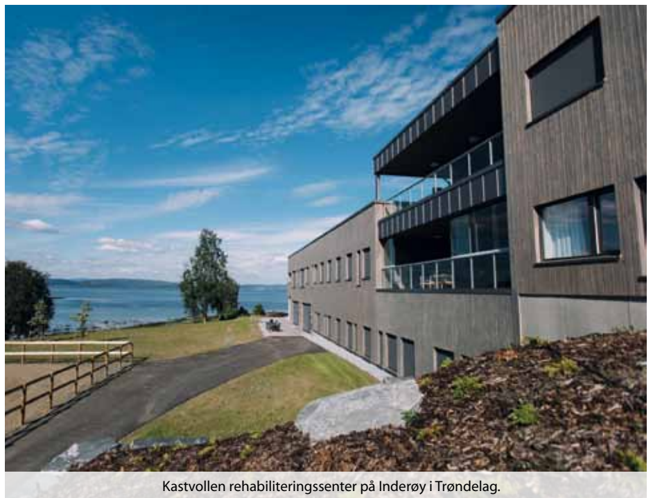
Kastvollen rehabiliteringssenter på Inderøy i Trøndelag.

Vi håper at det flotte tilbudet som Kastvollen rehabiliteringssenter representerer, blir tilbudt til de som har nevrologiske sykdommer i landet. Det er et tilbud for livskvalitet og et verdig liv, rett og slett en skikkelig vitamininnsprøytning!