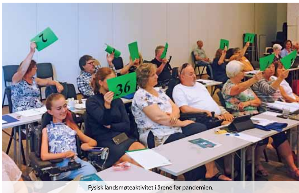
Fysisk landsmøteaktivitet i årene før pandemien.